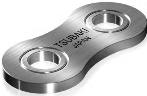
Abb.13 Stanzringverdichtete Verbindungsgliedplatte

Durch die Anwendung von TSUBAKI's Stanzring-verdichtung an der Verschlusslasche wird die volle kW Leistung der Kette erzielt.