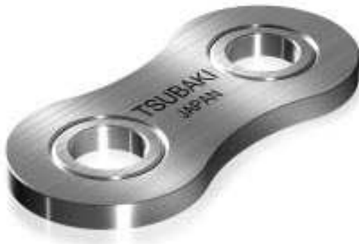
Abb.13 Stanzringverdichtete Verbindungsgliedplatte

Durch die Anwendung von TSUBAKI's patentierter Stanzringverdichtung an der Verschlusslasche wird die volle kW Leistung der Kette erzielt.